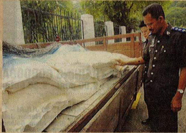
Pegawai MAQIS menunjukkan barang kes yang dibawa ke mahkamah sesyen, semalam.

Daripada laporan analisis mendapati bahan mentah itu mengandungi DNA jagung, menunjukkan ia suatu keluaran pertanian.