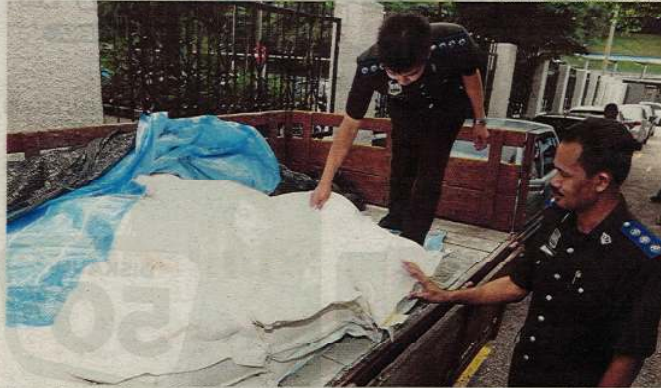
Pegawai penguat kuasa MAQIS menunjukkan sebahagian tepung jagung yang cuba dieksport ke Singapura tanpa permit MAQIS ketika perbicaraan di Mahkamah Sesyen Johor Bahru, semalam.

Pengurus syarikat mengaku salah tak dapat kelulusan MAQIS